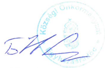
Tóth Szilárd polgármester